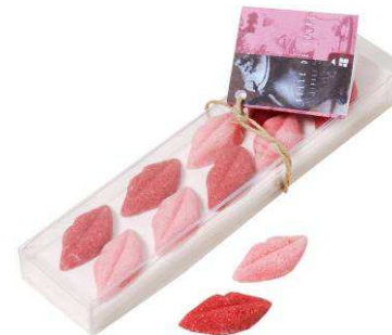
20g 4.50 €