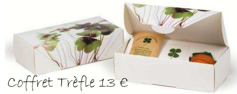
Coffret Trèfle 13 €

Des petits cœurs pour dire « Je t'aime » aux fous de pâtes... 250g 1.40€