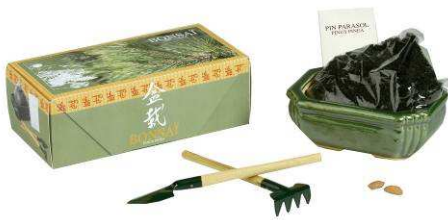
Coffret Bonsaï 14.95 €