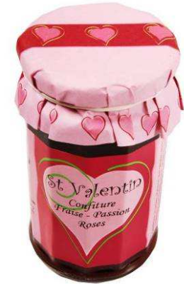
270g 3.50 €

Un pot rose d'amour aux fruits défendus: fraise-passion-roses