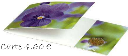
Carte 4.60 €