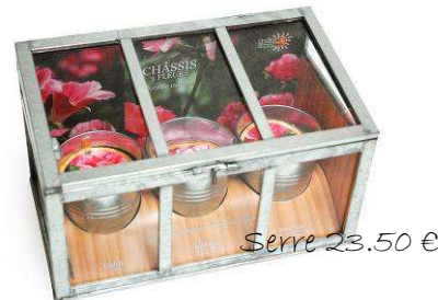
Serre 23.50 €

Des boîtes tendres pour des mélanges sensuels de thé à la rose ou au chocolat. 100g 14€